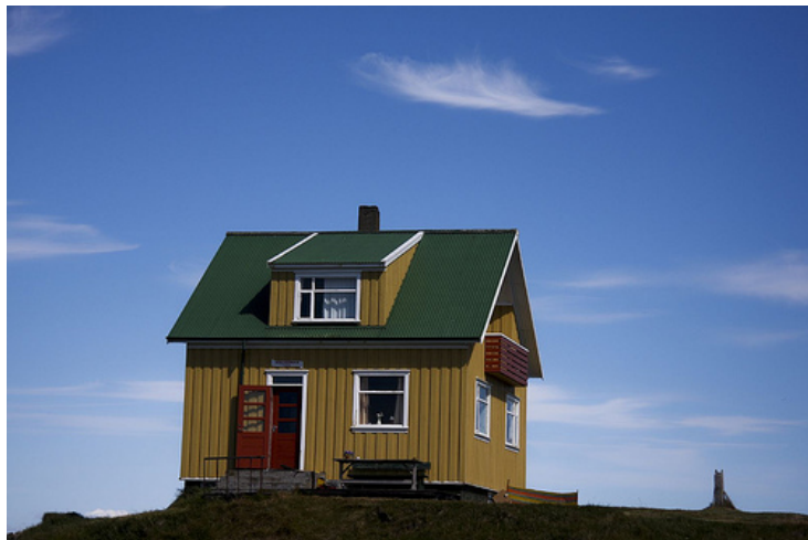
Sólheimar , Flatey